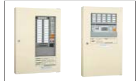
再鳴動機能付きの受信機