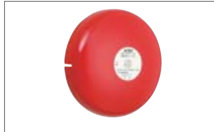
確実に聞き取るための措置 （例：非常ベルの増設等）