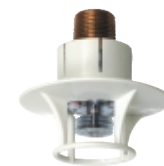
スプリンクラーヘッド

特定施設水道連結型スプリンクラー「新発売」 専用小型ポンプ・補助水槽を標準装備。 水道の給水制限や圧力不足でも問題ありません。