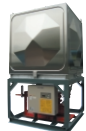
専用小型ポンプ(+補助水槽)